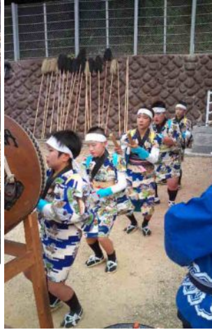
小学生による太鼓踊り →