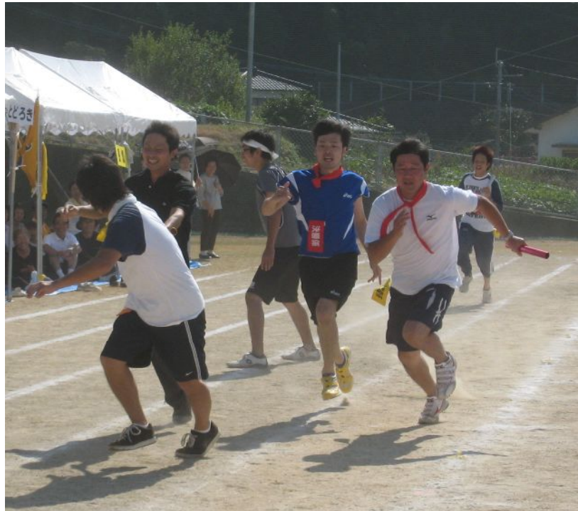
年齢別地区対抗リレーでのデッドヒート!大混戦でした!

9月20日(日)、下田北小学校と地区合同の運動会を開催しました。合同で開催するのは今年で7回目。午前9時に児童の元気な入場行進で運動会がスタート。若者男女問わず、日頃運動不足の方や、昔は走って速かったけど