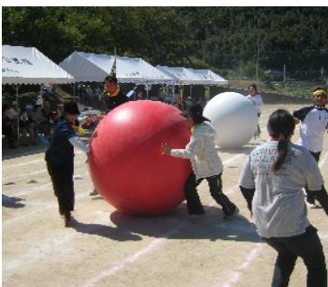
大玉転がしでは転倒者続出!