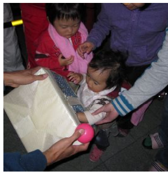
こんなに小さい子も参加！