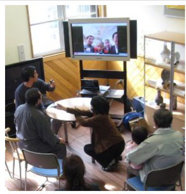
↑ テレビの映像が東京の会場