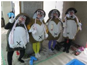
タヌキのご夫婦もお祝いに!?