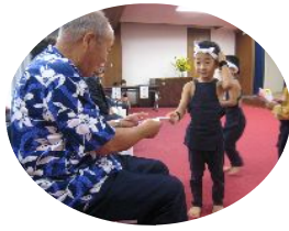
保育園児より敬老者へメッセージカードのプレゼント