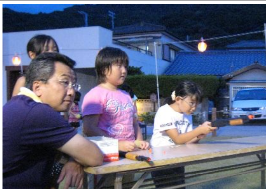
狙いを定めて「ハーン!」

2日目は精霊・灯ろう流しを実施。今年は潮の関係で長畑公民館前で精霊舟を流しました。この場所から流すのは初めてでしたが、ご協力無く実施することができました。灯ろう作成にご協力