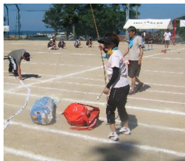
ああ大漁では大物が釣れました!