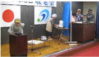
寸劇も役者ぞろいで迫力満点!!