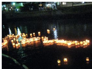
↑ 優雅に流れる灯ろう ヨン様も駆けつけました →