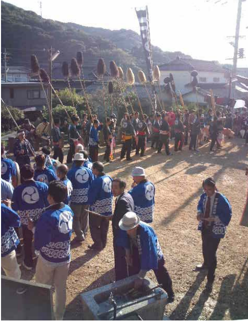
↑ 終盤、境内の中を巡回

来年は更に太鼓打ちの小学生が少なくなるため、3年生以上を対象として8月頃から練習をしたいと考えているところでした。