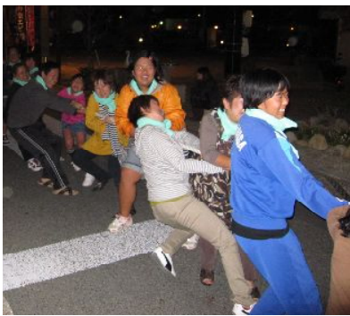
力強く、そして楽しく引っ張ってます