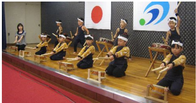
しらすぎ保育園による太鼓の披露