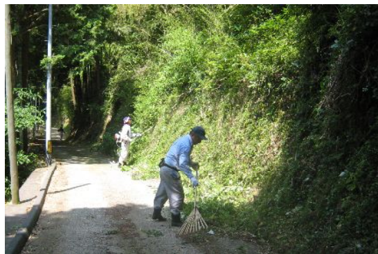
沿道沿いの草刈り作業中

10月18日(日)、下田北地区一斉クリーン作戦を実施しました。主に主要道路沿いの草刈りを行い、併せてさくら公園付近の花壇の草引きも行いました。