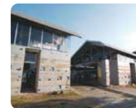
①天草ビジターセンター