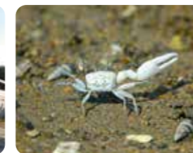
②ハクセンシオマネキ