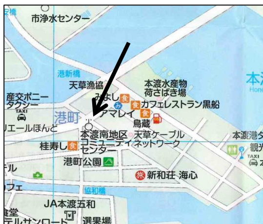
本渡南地区コミュニティセンター 位置図