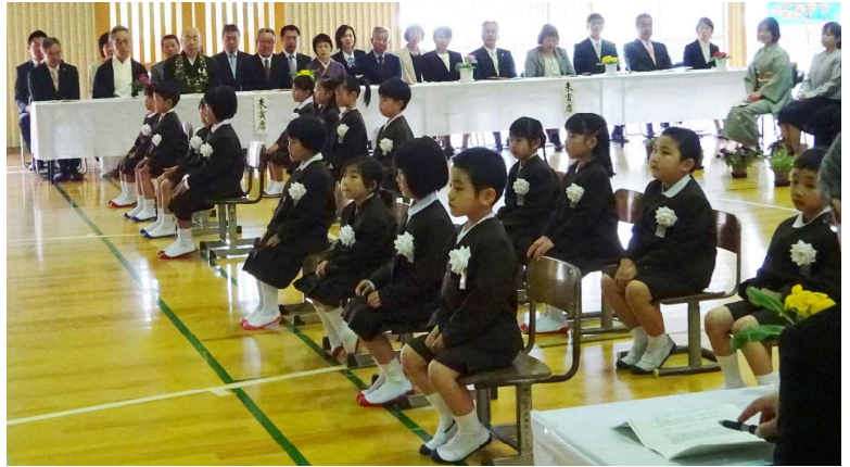
(おはなしきちんと聞いています。 ちょっと緊張 1年生)

平成31年4月9日(火)、学校運営協議会の皆様をはじめ、地域の皆様のご臨席のもと16名の新入生を迎えて、平成31年度本町小学校入学式を行いました。今年の本町小学校は昨年度よりも5名が増えて全校児童77名となりました。16名の新入生は、在校生に負けないくらいのお行儀の良さ、そして元気いっぱいの返事で参加できました。この良さを小学校生活6年間で更に伸ばしていけるようしっかり頑張っていきたいと思います。地域の皆様にもいろいろなどころでお世話になりますが、どうぞよろしくお願ひ致します。