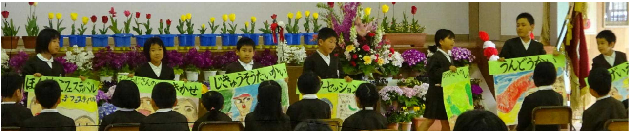
(ようこそ1年生 学校は楽しいですよ。 学校紹介をがんばる2年生)