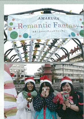
あまくさロマンティックファンタジーのボランティアに参加

天草高校ではボランティア活動が活発に行われており、多くの生徒がボランティアとして参加しています。今年度は、花しょうぶ祭りやハイヤ踊りなどイベントの運営補助や、あまくさ子どもフェスティバルや福祉まつりなどの地域の方々やフェスや活動、天草国際ボランティアスロン記念大会や天草マラソン大会などのスポーツイベントの運営補助などに参加しました。特に、昨年度から天草市社会福祉協議会よりボランティア活動普及推進校として指定も受けており、生徒はより積極的にボランティア活動に参加しています。今年度のボランティア活動は下記のとおりです。