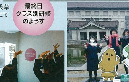
東京国立博物館前にて