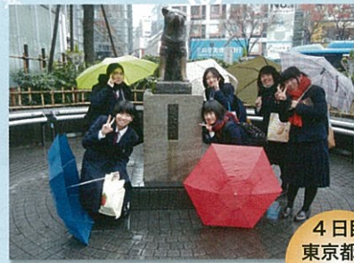
渋谷八チ公前にて