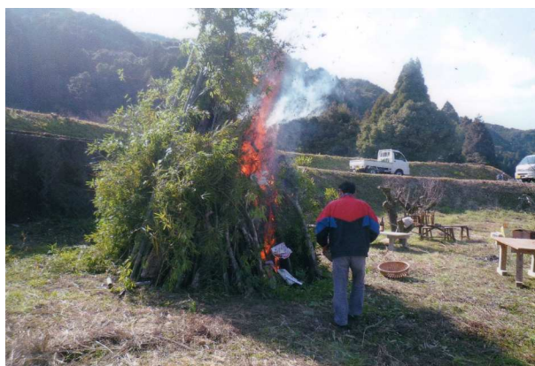
宇津木区鬼火焼きの様子

さて、平成23年度もあと3カ月を残すのみとなりました。これまでの地区振興会（公民館）の各種事業も計画通りに盛会のうちに終了し、温かいご理解とご支援に深く感謝申し上げます。ご承知のように、栢宇土小は宮地岳小、亀場小と統合され4月から「亀川小学校」として新設開校いたします。この1年、実行委員会を立ち上げて閉校に向けての記念事業を取り組んでおりますが、町民の皆様や多くの卒業生の多大なるご芳志により、計画のとおり進んでおります。改めてご案内をいたしますが、来る2月26日に閉校式典の予定であり、栢宇土小136年の長い歴史を閉じる式典に華を添えていただきますよう、多数のご出席をお願い申し上げます。今年も皆様にとりまして幸多い1年となりますとともに、健康でご活躍を祈念いたします。