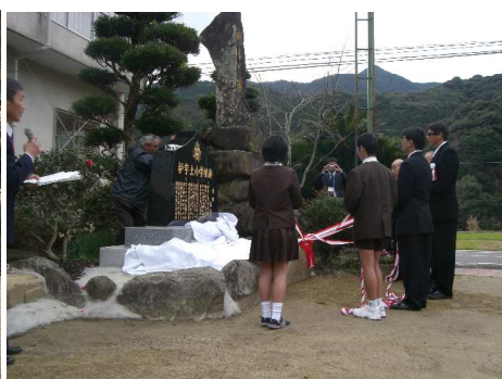
↑ 小学校閉校記念碑除幕