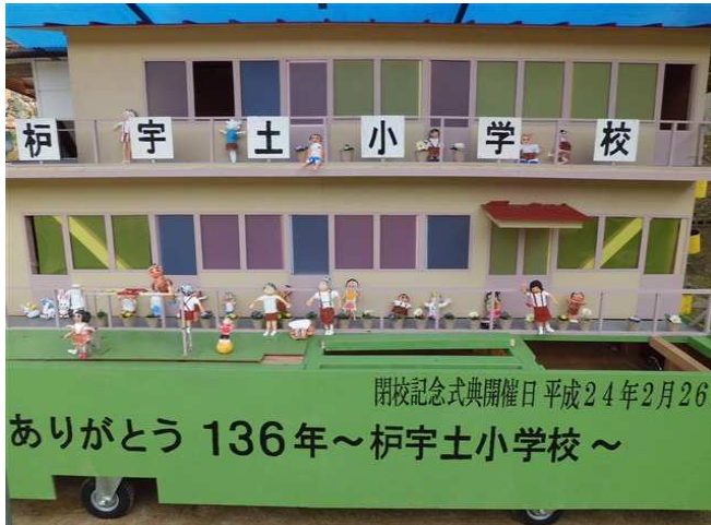
↑ 昨年ハイヤ道中総踊りで 校舎をモデルとした山車