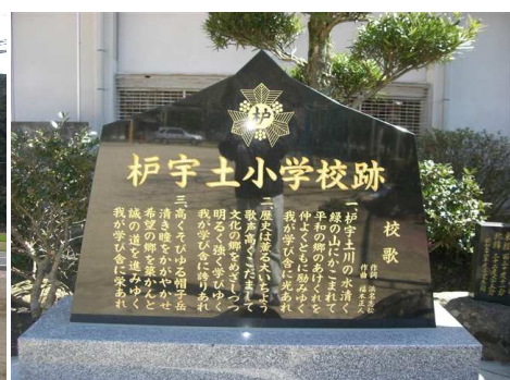
↑ 小学校閉校記念碑