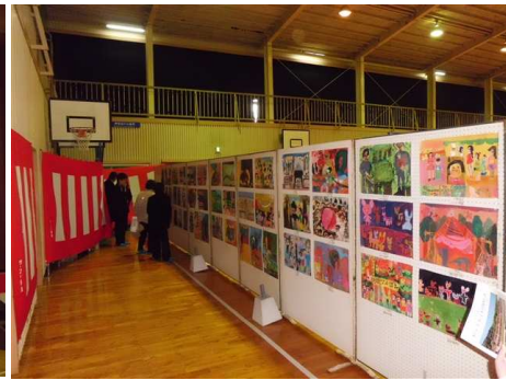
↑ 小学校創立100周年時 タイムカプセル収納作品