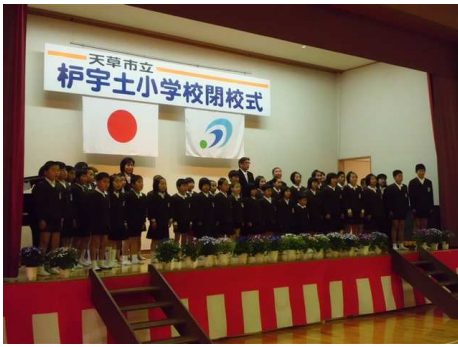
↑ 小学校最後の全校生徒の合唱