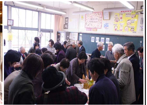
↑ 思い出の給食会の様子