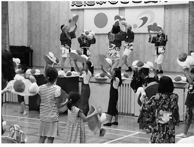
民族舞踊教室踊り ソーラン節・花笠音頭