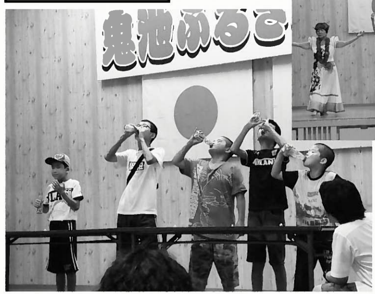
ラムネ早飲み競争