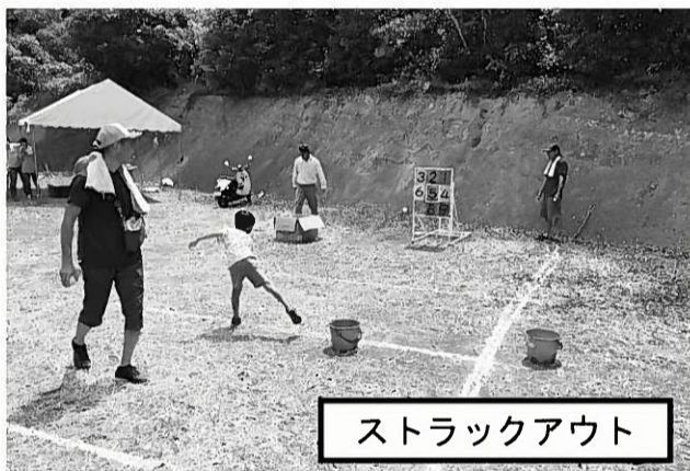
ストラックアウト