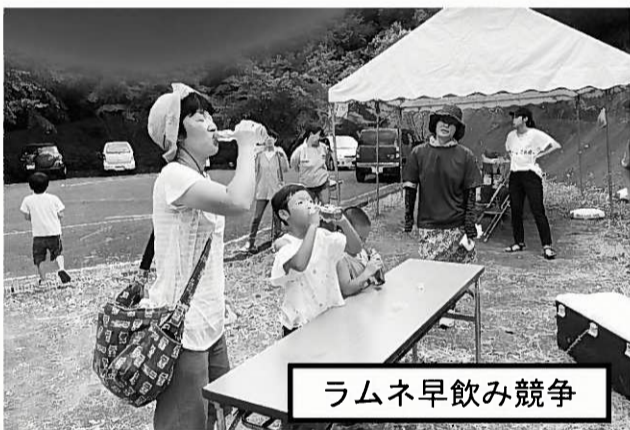
ラムネ早飲み競争