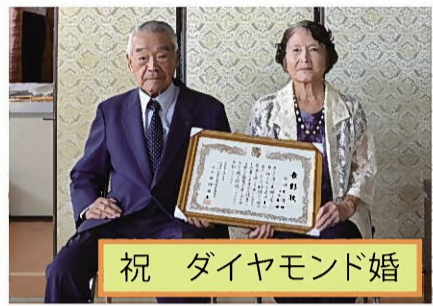
祝 ダイヤモンド婚