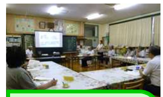
9/3 第3回学校運営協議会の様子