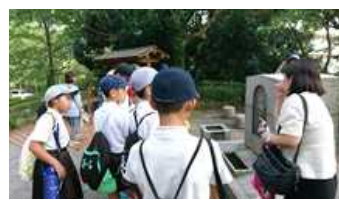
山里小、あの子らの碑