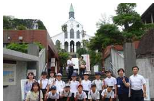
世界遺産大浦天主堂