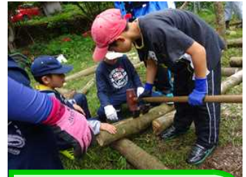
6年生はくさび打ちも