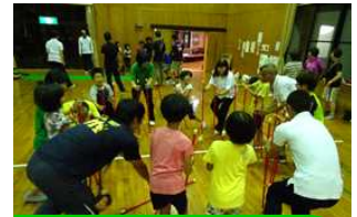
コースポ-ツがいっぱい

9月7・8日(金・土)、本町地区振興会、本町体育協会、天草市スポーツ推進員の皆様により、本年度も寺子屋体験「山学校・川学校」が開催されました。今年も、33名の本町小児童が参加しました。2日目はあいにくの雨になり、体育館での活動になりましたが、どの児童からも楽しかったの声が聞かれました。地域の方々の愛情を全身に感じた2日間、ありがとうございました。