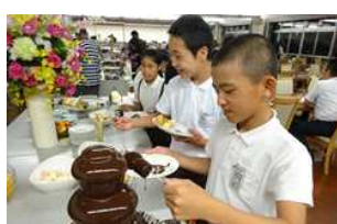
夕食はバイキング