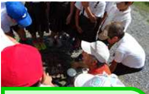
全学年 きれいな花を咲かせよう 野菜名人さん