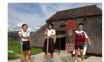
吉野ヶ里 気分は弥生時代