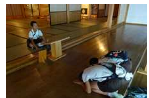
長崎奉行所跡 お白洲