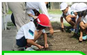
1,2年 冬野菜をうえよう 野菜名人さん