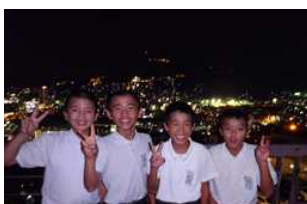
長崎の夜景は最高