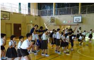
全学年 天草支援学校 につきり交流