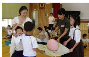
4年生 天草支援学校 わくわく交流