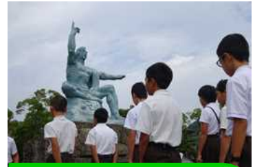
平和祈念像前で平和集会

係活動などを通して学んだこととあわせて、成長を頼もしく感じるとともに、これからの本町小のリーダーとしての活躍を更に期待する充実の2日間でした。