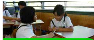
上 お話し道場の様子 右 ビジョントレーニングでの使用プリント

現在本校では、国語科の学力向上に特に力を入れています。授業の研究にあわせて、毎月1回ずつ「お話し道場」「ビジョントレーニング(目の動きのトレーニング)」を取り入れています。これは個人の話す力、聞く力をアップするためのものです。