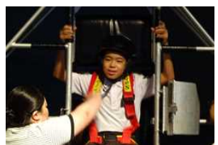
佐賀宇宙科学館 緊張!