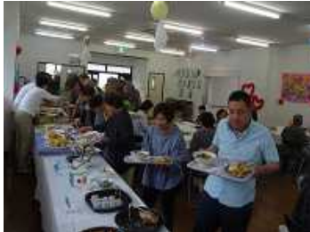
かけがえのない時間