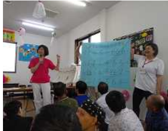
笹の葉もお星様もりりんんと