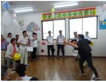
これが意外と難しい…

その後は職員が歌ったり、新職員が目隠しでボールを取れずに転んだりする中、終始楽しい雰囲気の中で過ごす事が出来ました。『紙風船』様による琴とハンドベルの演奏には参加できない利用者の方も一体となっていたように思えます。ご家族の皆様と過ごした一時が、利用者の皆様にとって良い思い出になるように来年も楽しめる交流会が開けるように努めてまいります。