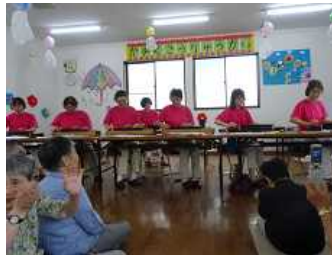
琴の調べに飛び立つ宇宙戦艦