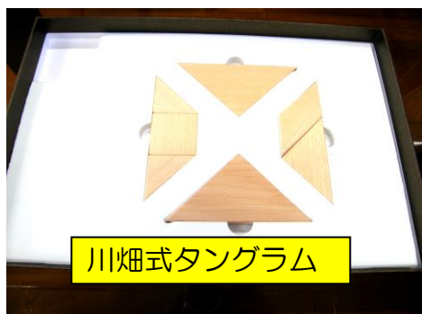
川畑式タングラム