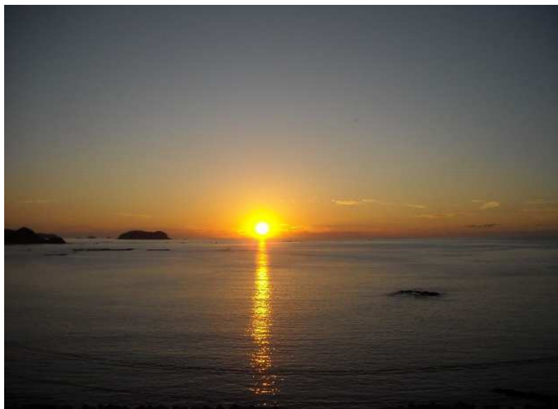
(おにきん夕陽が丘からの風景)