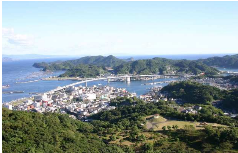
(桜木展望所からの牛深地区の風景)