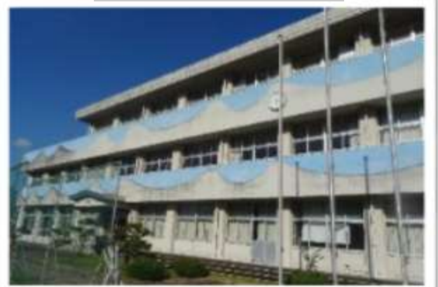
旧)御所浦北中学校 現)ふれあい塾弁慶ヶ岳

☆人 □☆ 御所浦北地区：269世帯 男：305人 女：304人 計：609人 ※R1.11月末現在