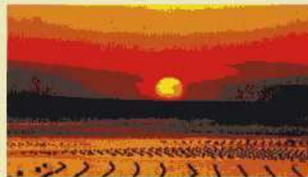
日本の夕陽百選のまち