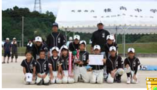
市子連ソフトボール大会

8月9日、本渡綾南中学校グラウンドで行われた市子連の大会で、一町田子供会は暑い中4試合を勝ち抜き、小体連に引き続き優勝し、県大会出場の切符を獲得しました。