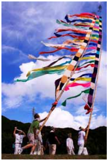
最優秀作品「風にむかって」

今年で3回目の「フォトコンテスト」に16名71点の作品応募がありました。結果は下記のとおりです。(敬称略)