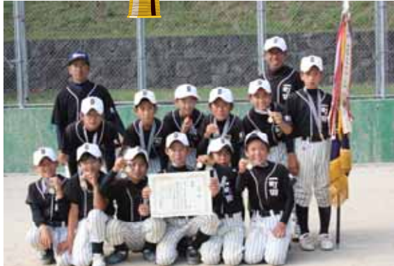
(菊池多目的グラウンド) 県子供会ソフトボール大会

また、同23日に菊池多目的グラウンドで行われた県大会で、決勝戦の深海子供会(天草対決)を逆転で下し、見事優勝しました。