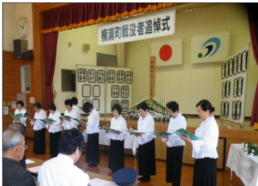
童謡コーラス楠の花の皆さんによる献歌