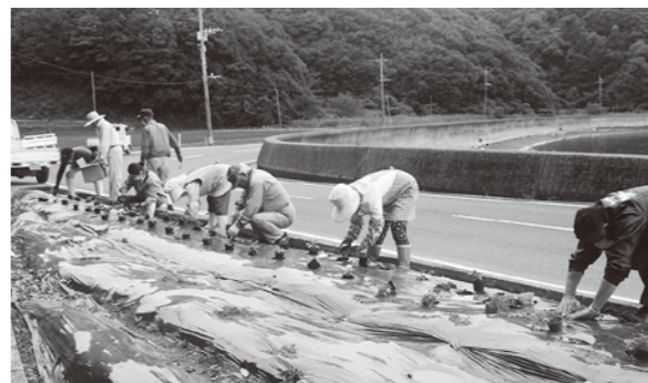
立地区の花植え作業

6月6日の朝8時より宮南の立地区・二本木地区・高根地区で花植えを実施しました。一週間前に耕起し、マルチシートを張った花壇に、サルビアや日々草など、およそ400株の苗を植栽。梅雨の長雨により天候が心配されましたが、当日は晴天に恵まれ、30名の参加者が和気あいあいの中で作業を楽しみました。宮南地区を通行の際は、ぜ