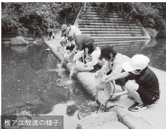
稚アユ放流の様子