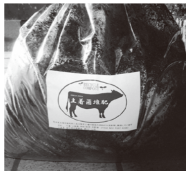
ラベルが新しくなりました

昨年も紹介しましたが、効果が期待されます。土着菌前より、土着菌と土着菌堆肥(粉末)は碓石地区コミュニティセンターにて注文販売を受け付けています。土着菌堆肥は、しんわ夕やけ市場や中田地区コミュニティセンターでも販売しています。また、土着菌堆肥の製造に興味のある方は、製造過程を見学することができます。お気軽にお問い合わせください。お待ちしております。