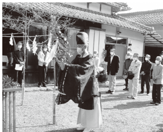
豊作への祈りを込めて

4月26日に、小宮地虫追い保存会の主催による虫追い祭りを開催しました。今年、コロナ対策で虫追い踊りを取り止め、神事のみが執り行われました。御幣を各地区の田んぼの畔に取り付け、今年の豊作を願いました。