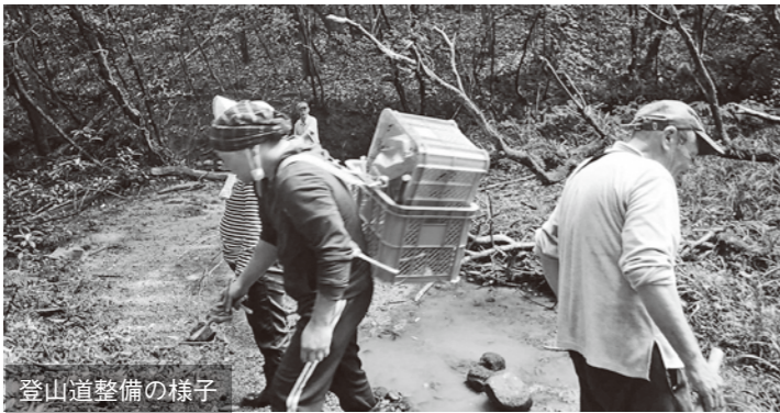
登山道整備の様子

令和元年度から2年度にかけて天草市チャレンジ支援交付金を活用し取り組んできた「神掛けの滝登山道整備事業」が無事完了しました。土地所有者の協力を受け、登山者向けの駐車場や案内所の整備を行ったほか、登山道の倒木伐採や補助ロープ設置など安全対策も講じました。この1年間で市内外から、500人近い来訪者があつています。振興会では、今後も積極的に滝のPRを行っていきます。