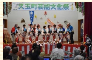
▲芸能文化祭：ステージ部門