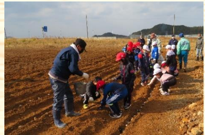
遊休地利活用実証事業参画 ▶