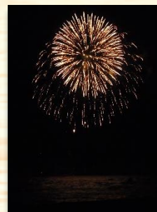
魚貫町花火大会 (協賛) ▶