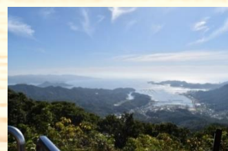
▲地域めぐりウォーキング：権現山