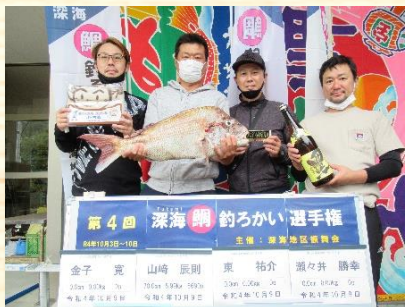
▲「鯛釣ろかい選手権」

深海地区振興会では、『恵まれた自然と共生し、快適に暮らせるまちづくり』をテーマに、令和4年度は「六郎次山ウォーキング大会」「七夕製作設置」「花火大会」「環境美化運動」「グラウンドゴルフ大会」など実施しました。特に、「鯛釣ろかい選手権」は、例年、土曜と日曜の2日間の開催でしたが、今年度は8日間に延長し、コロナやお天気対策を講じて、さらなる地域経済の活性化を図りました。