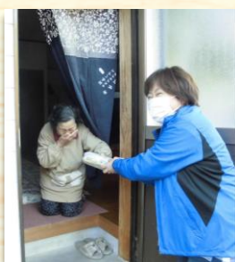
◀まごころ弁当 宅配便