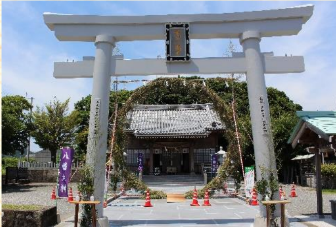
▲日本随一うしぶか茅の輪まつり

牛深地区振興会では、今年度から新たな取り組みとして「日本随一うしぶか茅の輪まつり」「牛深SUMMERランタンフェスティバル」「遊休地利活用実証事業」などを行いました。地域住民に楽しんでもらえるような、また地域が少しでも賑わうような事業をこれからも行っていきます。