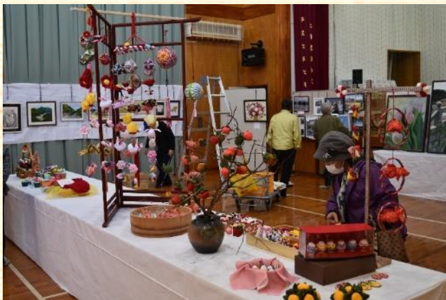
▲芸能文化祭：展示部門

久玉地区振興では「“地域を挙げて”が実感できるまちづくり」をテーマに各種活動を行っています。今年度は「コロナ禍の中でも出来ることはやってみよう！」と、感染対策を徹底してグラウンドゴルフ大会、芸能文化祭、地域めぐりウォーキングなどの行事を開催しました。