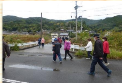
▲いきいきウォーキング 自然の中でウォーキングを楽しみながら健康増進、参加者相互のコミュニケーションを図るため実施。

二浦地区振興会では、今年も新型コロナウイルス感染拡大防止のため、屋外でのイベントを中心に実施してきました。実施した事業を紹介します。また、下記の事業の他にも、緑化整備事業、一斉清掃事業などを実施しました。