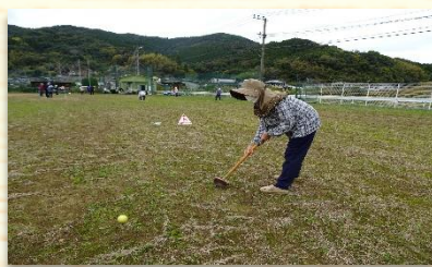
▲グラウンドゴルフ スポーツを通しふれあいを深め健康増進を図るためグラウンドゴルフを実施。