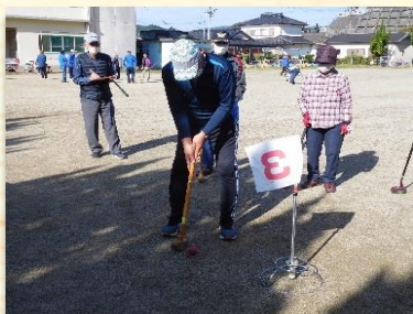
▲グラウンドゴルフ大会

魚貫地区振興会では、「魚貫に住んでよかった」と思えるまちづくりの実現を目標に各種活動を行っております。令和4年度は、新型コロナウイルス感染拡大防止のため、出来る行事が限られる中、グラウンドゴルフ大会、まごころ弁当宅配便、魚貫町花火大会の協賛などを行いました。