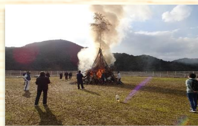
▲どんどこや 無病息災を願い毎年実施 70名程の参加で毎年楽しみにされている。