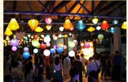
▲牛深SUMMERランタンフェスティバル