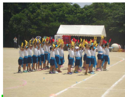
衣装も素敵・ダンス（低学年）