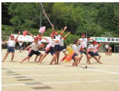
赤団・白団の力結集：応援合戦