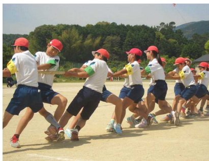
力を合わせてワッショイ：綱引き