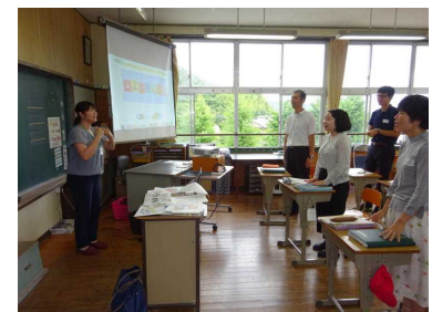
先生達の研修の様子