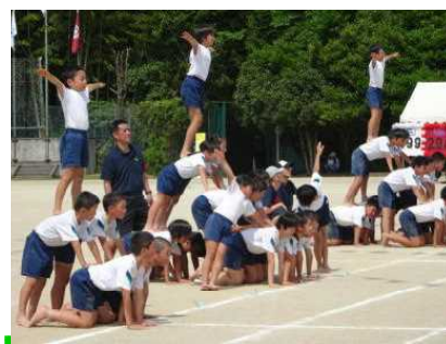
見事成功：組体操（高学年）