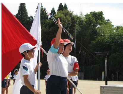
力強い“誓いの言葉”