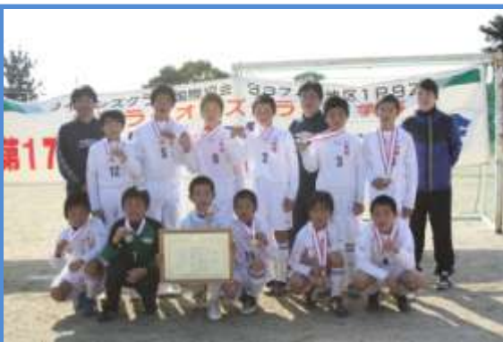
準優勝の一町田サッカークラブと先生

2月21日に牛深総合グラウンドで行われた、第17回牛深ライオンズ杯サッカー大会に参加し、予選の2試合・準決勝を勝ち抜き、決勝戦で牛深小サッカークラブと対戦し惜しくも2-4で破れ準優勝でした。6年生は小学校最後の試合で、最後まで一生懸命ボールを追いかけていました。