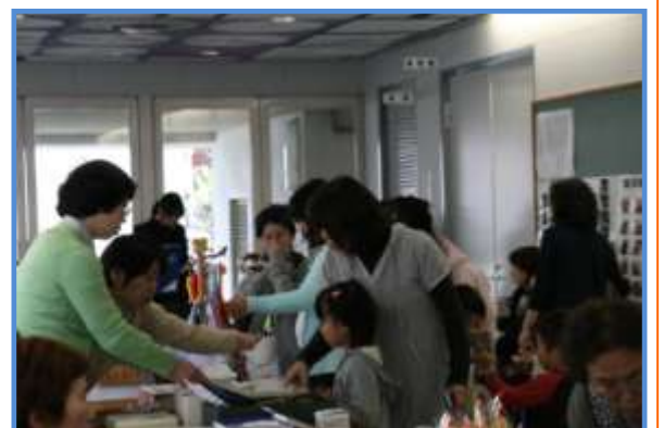
昨年のバザーの一コマ！