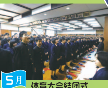
5月 体育大会結団式