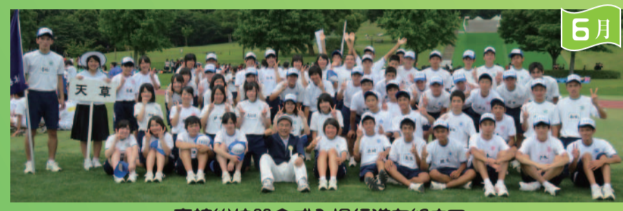
高校総体開会式入場行進を終えて

天高育友会報 平成27年7月17日発行 発行 県立天草高校育友会 編集 天高育友会文化広報委員会 印刷 ワタナベデザイン