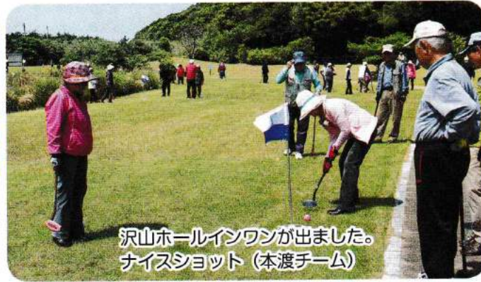
沢山ホールインワンが出ました。 ナイスショット(本渡チーム)