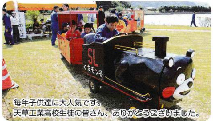
毎年子供達に大人気です。天草工業高校生徒の皆さん、ありがとうございました。