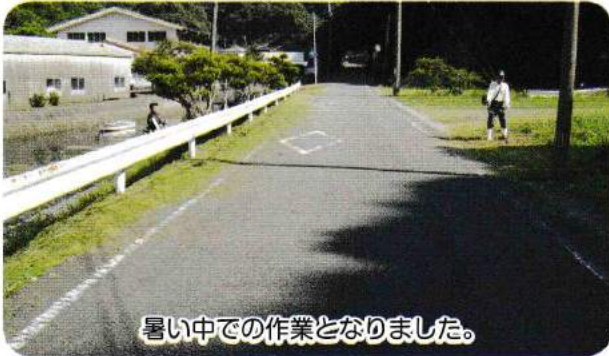
暑い中での作業となりました。