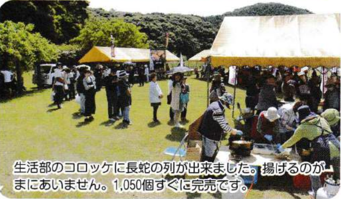
生活部のコロッケに長蛇の列が出来ました。揚げるのがまにあいません。1,050個すぐに完売です。