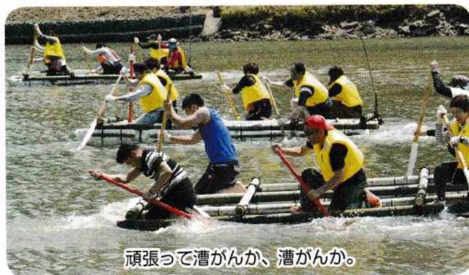
頑張っって漕がんか、漕がんか。