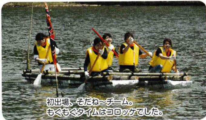
初出場、そたね〜チーム。 もくもくタイムはコロッケでした。