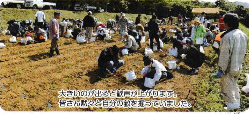
大きいのが出ると歓声が上がります。皆さん黙々と自分の畝を掘っていました。