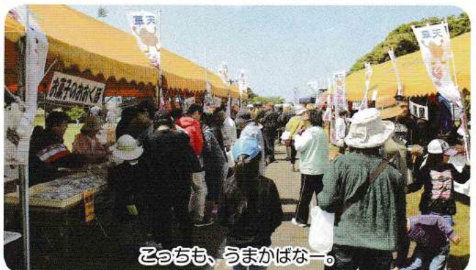
とろちも、うまかばなー。