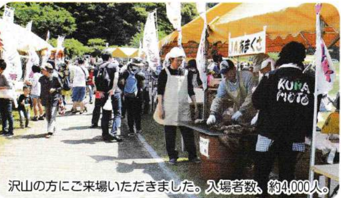
沢山の方にご来場いただきました。入場者数、約4,000人。