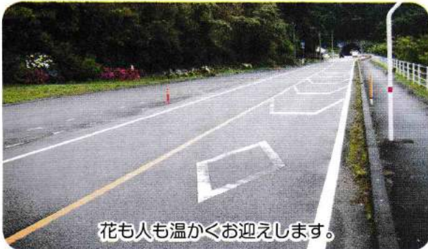
花も人も温かくお迎えます。

6月3日に大江一斉クリーン作戦を実施しまし た。除草や清掃作業が行われ、国道沿いや集落付近 の市道もとてもきれいになりました。5月3日に富 津地区世界遺産登録の勧告が発表され、大江にも多 くの観光客が見込まれるため、今年は特に力の入っ たクリーン作戦だったと思います。ご協力頂いた皆 様方に感謝申し上げます。 福祉環境部会