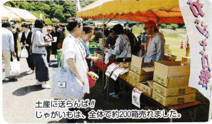
土産に送らんば!! じゃがいもは、全体で約200箱売れました。