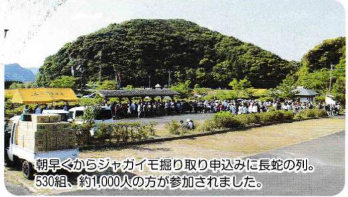
朝早くからジャガイモ掘り取り申込みに長蛇の列。530組、約1,000人の方が参加されました。