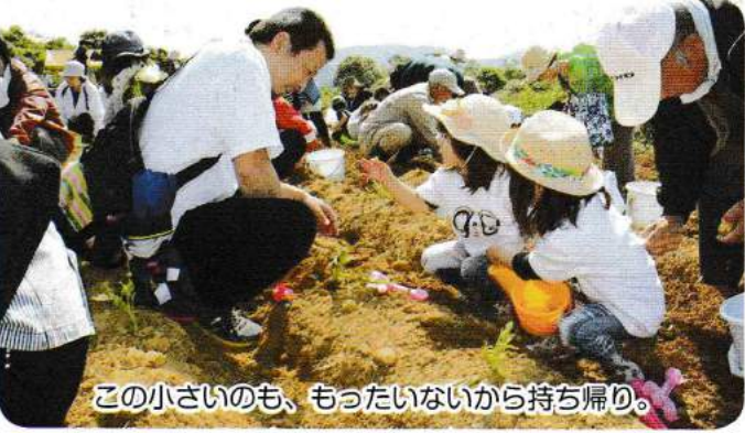
この小さいのも、もったいないから持ち帰り。