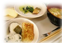
豚汁&おにぎりセット