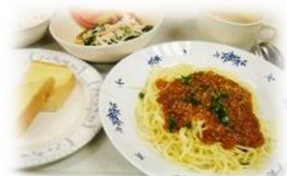
ミートスパゲティ & トースト

その他にも、利用者の方の体調や、食べやすい大きさについてなど、指導員や保護者と連携をとったり、食のアンケート調査を行ったりなど、一人ひとりが「おいしい」と、楽しく食事をとってくださるよう日々配慮されています。