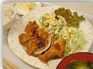
人気の『とんかつ定食』

かしの木学園の昼食は、利用者の方にとって楽しみの一つとなっています。和・洋・中とメニューも豊富で、保護者の方から、「安心でありがたい」というお声を頂いております。