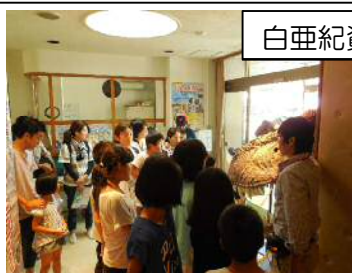
白亜紀資料館見学