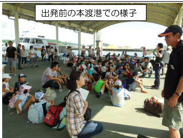
出発前の本渡港での様子