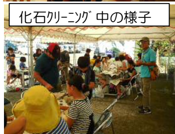
化石クリーニング中の様子