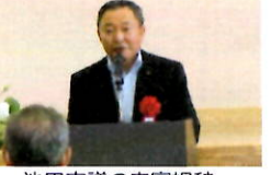
池田市議の来賓祝辞