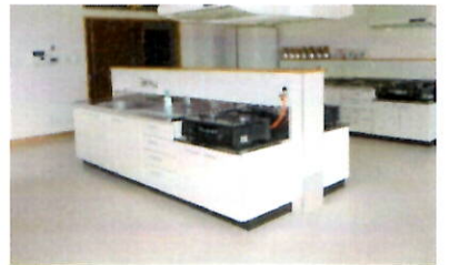
南東に面した明るい調理室