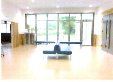
スッキリしたホール