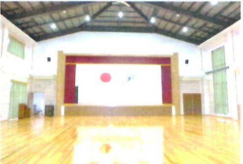
天井も高くミニバレーもできる集会室