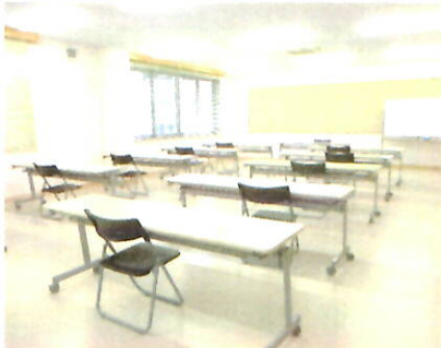
約40人収容できる大会議室