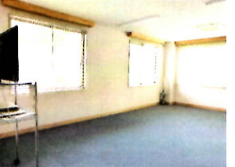
少人数の会議や軽体操もできる小会議室