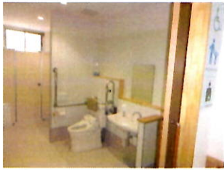
多目的トイレも完備