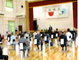
来賓・関係者約50名が出席して落成式が行われました