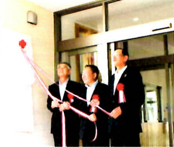
新しい看板の除幕式