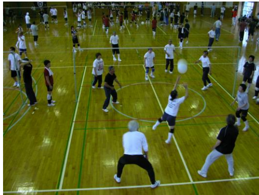
<50才混合の部> 葛河内区 VS 下町