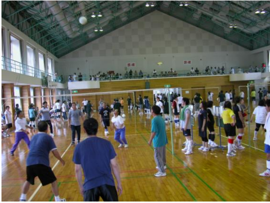
<40才以上>板之河内 VS 路木