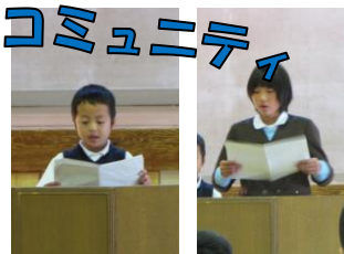
【全学年「人権の花運動発表会」】