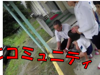
【3年「昔遊びをしよう」】