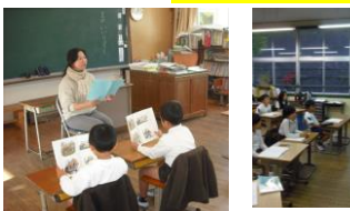
【1・3・5年「物語教材の導入・まとめ読み」】