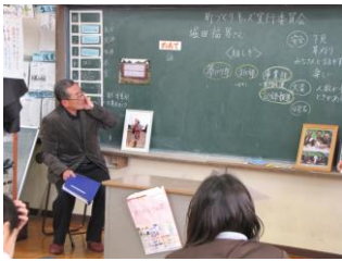
【6年「町づくりキッズ実行委員会」】