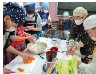
【6年「郷土料理を作ろう」】