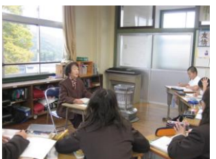
【6年「戦争と人々の暮らし」】