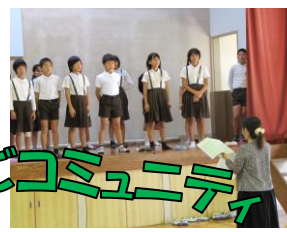
【6年「合唱指導・箏の演奏」】