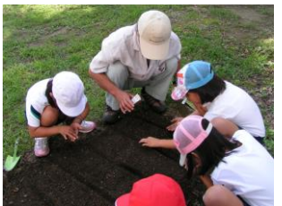
【1・2年「野菜の種まき・おでんパーティー」】