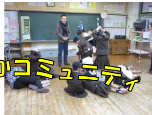
【2・4年「芸術表現体験」】