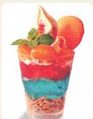
道の駅 宮地岳かかしの里