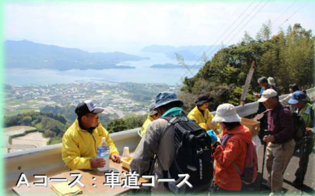
Aコース：車道コース