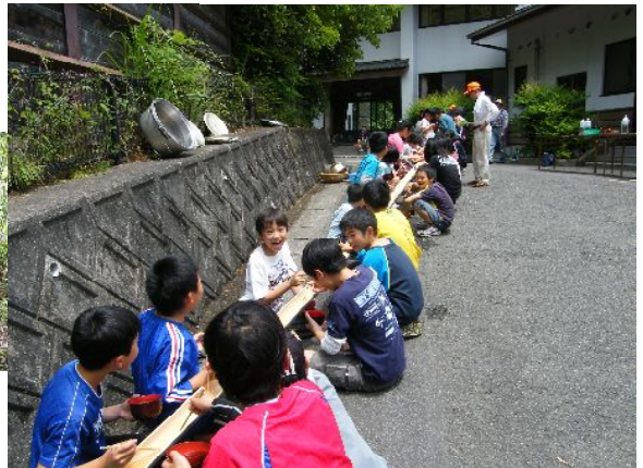
《おいしい流しそうめん》