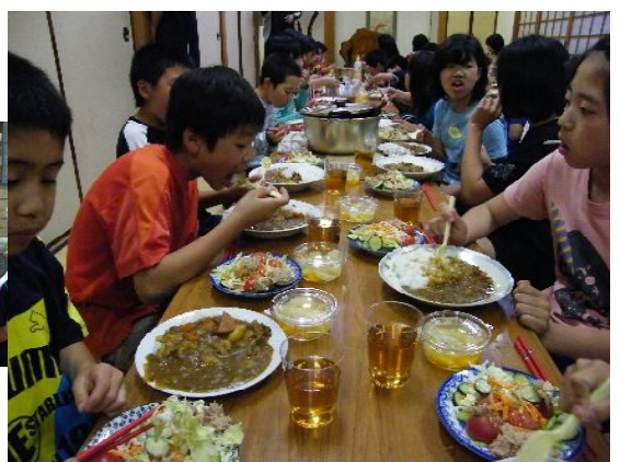
《みんなで楽しい食事》