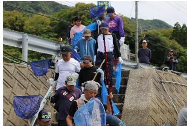
(タモ網片手にいざ、入場)