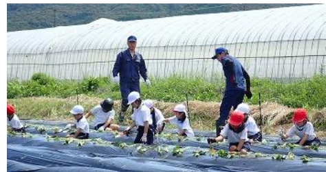
(1人10本ずつ植えていきます)