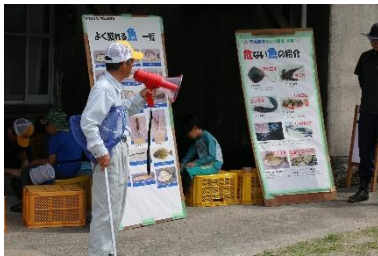
(魚について説明中)