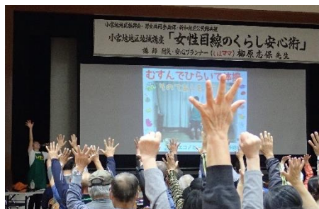
(むすんでひらいて)