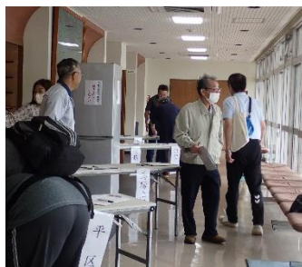
(ロビーにて避難者受付)