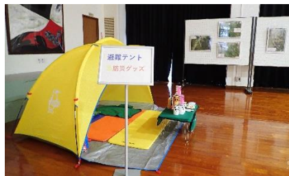
(避難者用屋内テント)