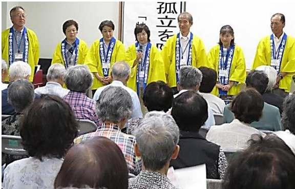
天草人権擁護委員の方々

6月25日、第2回老人大学が北地区コミュニティセンターで開催され、学級生65人が参加しました。今回は、天草人権擁護委員さんをお招きし、「高齢者の孤立を防ごう」をテーマに講演をしていただきました。その中で心理的虐待、経済的虐待、身体的虐待等が多くなってきている現在。「地域の人が早めに気付いてあげる。大きなお世話はしないけど小さなお世話はする。早期発見が大切」という話他、詐欺の手口として、手渡し型、振り込み型、送付型等を委員さんの寸劇を交えて、わかりやすく説明され、参加した皆さんは笑ったり頷いたりしながら熱心に聞き入っていました。