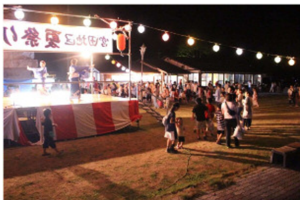
総踊りに参加した方にビンゴカードを！

8月14日(月)、倉岳大えびす像公園で宮田地区夏祭りを盛大に開催しました。 「ミミダンススタジオによる「ヒップホップダンス」を皮切りに、「浴衣・甚平コンテスト」や「空き缶釣りの競争」、「総踊り」、「ビンゴゲーム」などで大いに賑わいました。 また、射的・輪投げなどのゲームや、金魚すくい、ヨーヨーつりなどのコーナーでは、歓声があがり、大人から子どもまで楽しんでいただけたようでした。 フィナーレの花火大会では、約200発の打ち上げ花火が宮田の夏の夜空を美しく彩りました。 今年の夏祭りでは、「協賛店名入りうちわ」を作成し、宮田地区全戸と祭り会場来場者に配布しました。 ご協賛していただいた事業主様、また夏祭りに出演してくださった皆様、ご協力ありがとうございました。