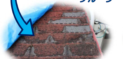
劣化し剥がれ落ちていきます