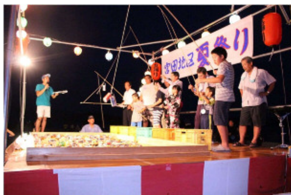
今年の空き缶釣りは数で勝負！