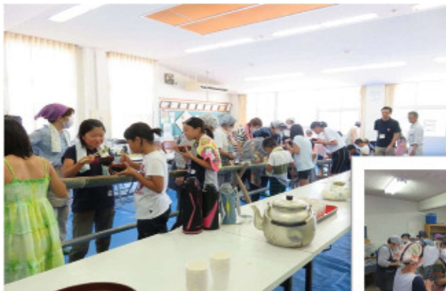
いつも以上に食べられそうです！