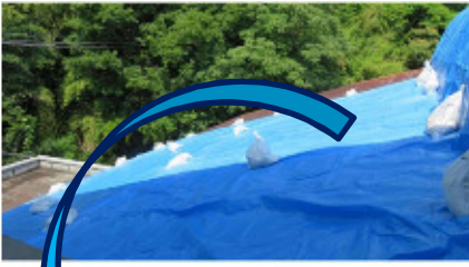
ブルーシートの下は・・・

宮田地区コミュニティセンター大会議室（旧ランチルーム）に、雨漏り対策でブルーシートを張っています。 数年前から市に改修を要望していましたが、市内には老朽化したコミュニティセンターが多くあり、緊急性の高いものから順次改修を進めているとのことでした。 見苦しい状況で、皆さまには大変ご迷惑をお掛けしますが、引き続き改修を要望していきますので、ご理解いただきますようよろしくお願いいたします。