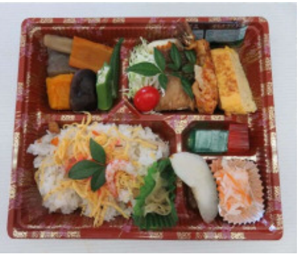
敬老会用弁当 ちらし寿司・鯛の塩焼き・

宮田地区民みなんでお祝いするという趣旨の下、今年度も敬老会のお弁当を作りました。バザーチームを中心に手際良く作業が進み、午前10時には完成！ お持帰り禁止で会場で食べていただきましたが、食べ残しはほんのわずかでした。それをみただけでも、丁度良い量で、何よりも美味しく食べていただけたのだとみなんで喜びました。 ご協力していただいた皆さん、前日からの準備、また当日は早朝からの作業、お疲れさまでした。本当にありがとうございました。