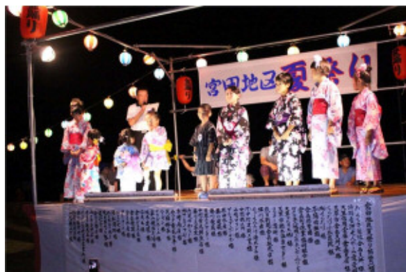
浴衣・甚平コンテスト結果発表！