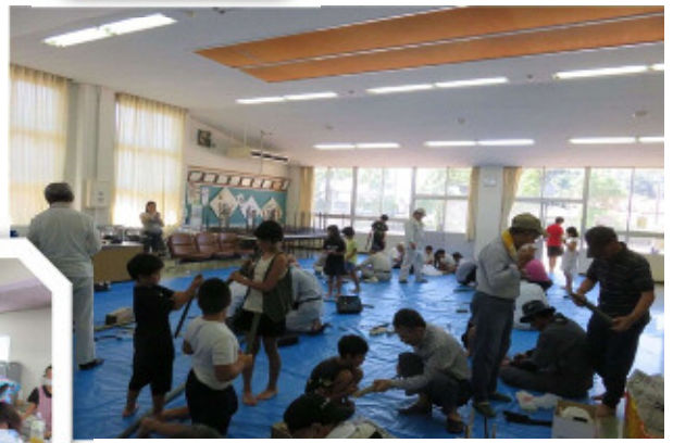
高齢者の方は昔を思い出しながらの作業