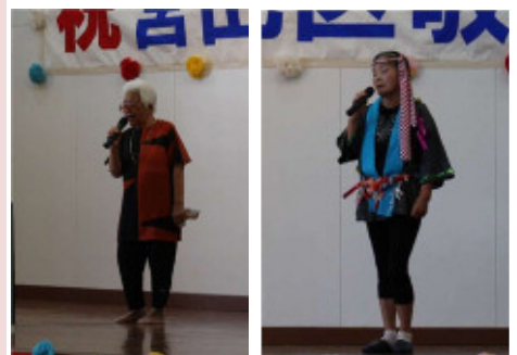
カラオケ同好会さんです。歌も上手ですが衣装もバッチリ！皆さん、毎週(木)午前10時から一緒に歌いませんか♪

また、最後は日向ひよっこ踊りの寸劇・踊りで楽しみました。多くの方が特に子ども達の踊りに惹きつけられていたようです。とてもひょうきんで上手でした。