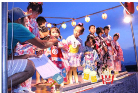
浴衣・甚平コンテスト出場者紹介