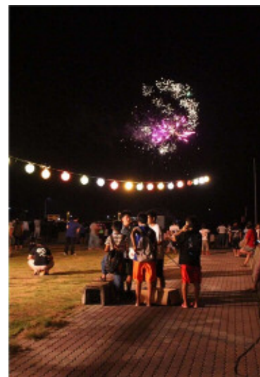
キレイな打ち上げ花火で今年の夏祭りが終わりました