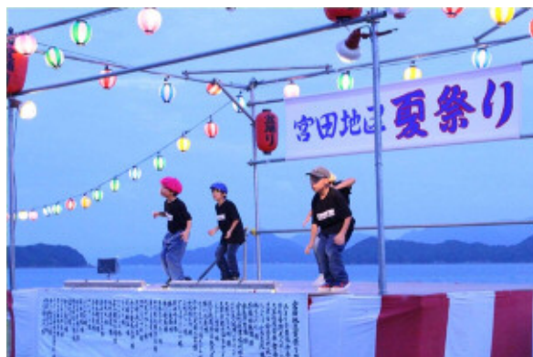
♪ヒップホップダンスでオープニング♪