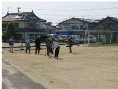
グラウンドゴルフのようす

五月十四日、第二十三回宮田地区分館対抗球技大会を開催しました。スポーツを通じて地区住民の親睦と融和を深めることを目的に、体育部会が毎年開催しているもので、ミニバレー、グラウンドゴルフ、ゲートボールの三種目に、約一五〇人が参加しました。好プレー・珍プレーに大きな歓声があがり、参加者は大いに親睦を深めました。 大会の結果は次のとおりです。