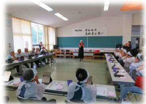
マッサージでシワを伸ばしましょう！