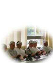
なかなかいいかも