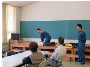
A E D取扱説明

平成二九年度より本格的に始動している生涯学習では、たくさんの方がこのコミセンを利用して下さっています。それに伴い、今年度のコミセン防災訓練は、卓球同好会の方にご協力していただき五月二九日(月)に実施しました。 少し落ち着きすぎの避難・誘導でしたが、消火器等の取扱説明・講話は真摯に聴講されていました。今回、ご協力してくださった皆さん、ありがとうございました。