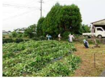
電柵の電源を入れる時は言って！