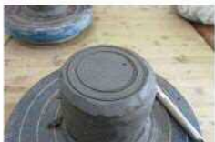
底に線を描き削る