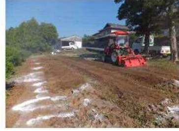
5/20 畝作り→黒マルチはり