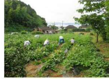
7/24 ツラ返し・除草作業

今年度も役員会で、バザー用の唐いもを栽培します。昨年度までは小豆もしていました。こっぴ餅作りもある為、畑全域に唐いもをビッシリ植えました。苗を植えて雨が降らない為、水不足で枯れ、苗を追加で植えたりもしました。 追加植え分が比較的小さいと感じましたが、絡まったツラ返し作業は無事終わりました。 近くで猪が出没するので、この畑にも電柵を設置しました。 ※電柵の電源はひと声かけて入れましょう！ 美味しい唐いもがたくさん収穫できますように。