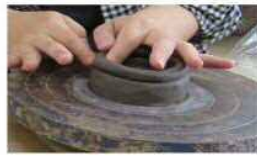
棒状の土を積上げる