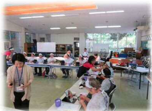
いつもよりも更にキレイに仕上がりました♡