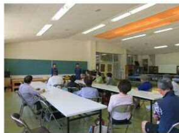
ありがとうございました。