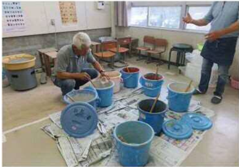
素焼きされたものに好きな色をつける