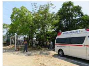
全員避難しました!