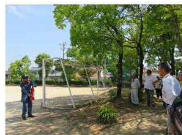
消火器の取扱説明