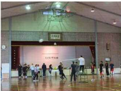
ミニバレーボールのようす