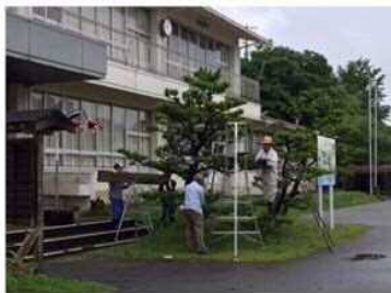
(7/12) 誰かが、晴れ男かも！