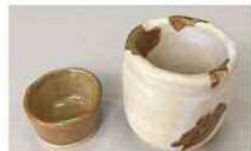
丈夫な湯呑の完成!