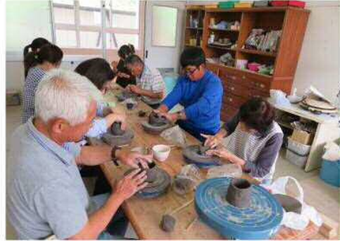
土を台の中心に置き作っていく