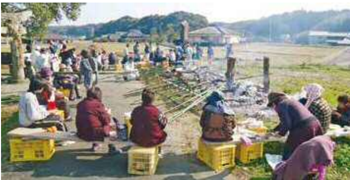
荒河内【参加者数ダントツ1位】