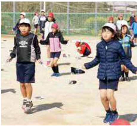
持久跳びにチャレンジ

最初の種目は「持久跳び」。3分間跳び続けることに挑戦しました。1年生から4年生までは2回まで失敗が許され、5、6年生は1回だけ失敗が許されます。3分間は短いようですが、縄に引っかかりずに跳び続けるのはそう簡単ではありません。それでも、たくさんの児童が3分間跳び続けることに成功し、満足げな