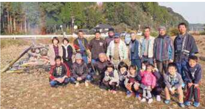
上野原【全員でハイチーズ】