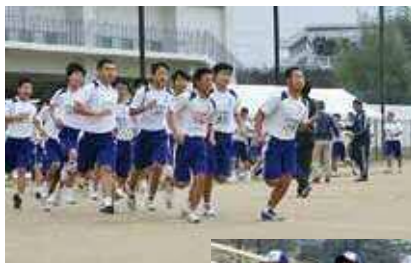
◀平成30年12月2日(日) 小中合同持久走大会

動の大会等、様々な場面で、随所に生徒たちの頑張る姿を見ることができました。文化祭の様子についてはこの広報誌でもお知らせしたとおりです。併せて、多種多様なボランティア活動においても多くの生徒たちが参加し、地域貢献に励みました。この一年間、地域においても様々なお立場から子どもたちを支えていただき、誠にありがとうございました。職場体験学習や保育実習をはじめPTA活動においても、パトロールや交通指導等各委員会の事業実施等大変お世話になりました。今後とも子どもたちの健全育成のため、ご理解とご協力をいただきますようよろしくお願い致します。