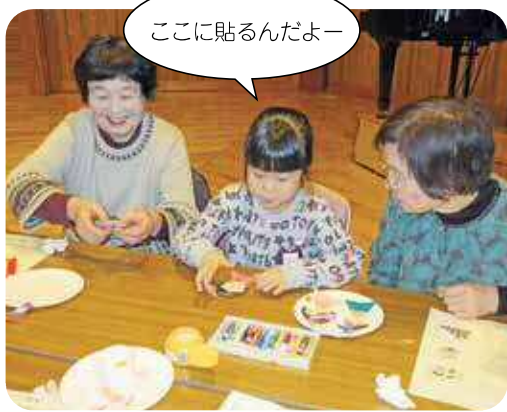
ここに貼るんだよー