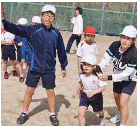
縦割り班長縄跳び

目標を持ってくじけずにごんばれる心と身体、仲間と助け合う絆づくりなど、児童の将来にとって大切な力を育む取組であったと感じています。