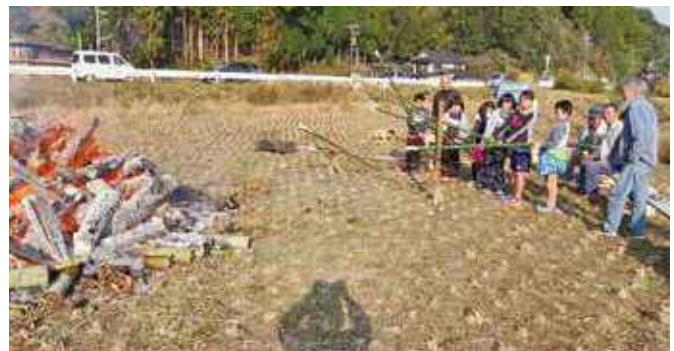
上野原【熱すぎて近づけな～い】