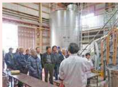
工場にて概要説明

八女市の「立花ワイン」では、現在城河原の「いく」を使ってワイン試作製品の製造を依頼しています。「立花ワイン」は、キウイ・あまおう・苺・いちじく・ゆずなど地元の農産物でフルーツワインを製造販売されており、以前すも