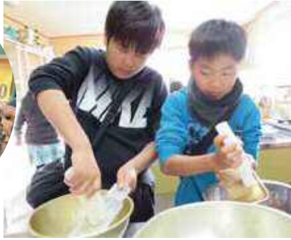
二人で初めての共同作業