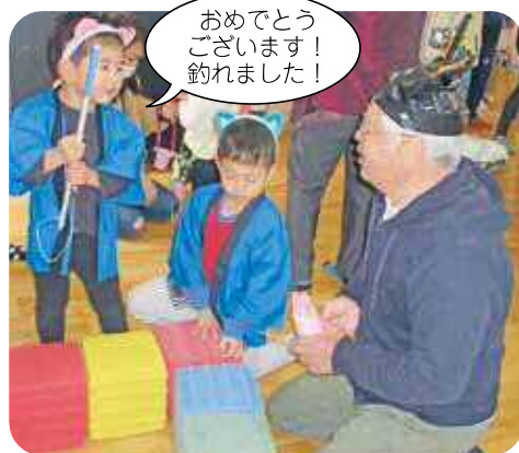
おめでとうございます！ 釣れました！

びの声が聞かれ、充実感でいっぱ いのようでした。みんなで作り上 げたお店やさんごっこを通して、 またひとつ成長した姿がみられま した。また、2月28日にはおおく すにて地域のおばあちゃんとのひ な祭りに年長児16名が参加しま した。お遊戯やうれしいひなまつ りの歌を披露した後、一緒にひな 人形の製作や会食を行い、交流を 楽しみました。おばあちゃん方に 優しく話し掛けて頂けてとても嬉し そうでした。