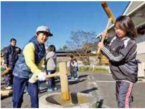
よいしょよいしょ！美味しくな～れ

臼と杵を使い友達同士や親 子で餅をついたり、保護者の 方や社会福祉部会の皆さんと 丸めたりと、一生懸命に取り 組んでいました。また、きな 粉餅や大根おろしとしょうゆ で食べたり、笹竹に小さくち ぎった紅白の餅をつけて飾る