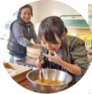
きなこ、うま～い！と ひとりじめ