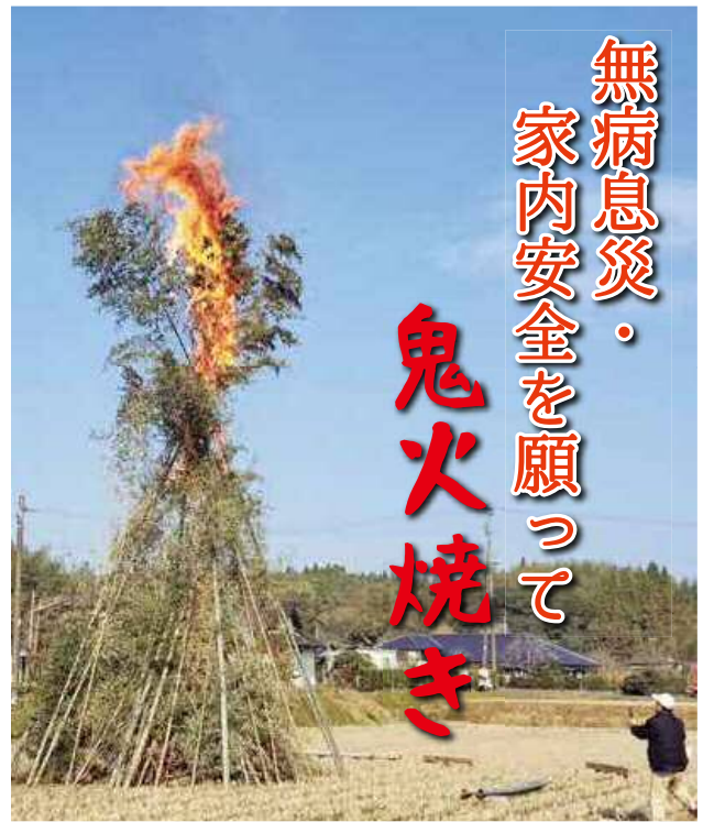
城木場【こんなところから火が～】

晴天に恵まれた1月6日 (日)、打越地区を除く3地区 で鬼火焼きが開催されました。 竹や木で作られたやぐらに 火がつけられると勢よく燃 え上がり、パンパンと竹の音 が響いていました。 冬の日差しの中、ゆつくり と餅を焼きながら皆で談笑し たり、中には少しお酒も入り ながら今年一年の無病息災・ 家内安全を願う鬼火焼きとな りました。