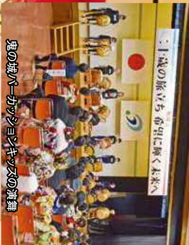
鬼の城パークサマソングキッズの演舞