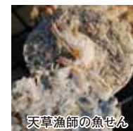
天草漁師の魚せん