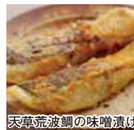
天草荒波鯛の味噌漬け