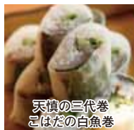
天草の三代巻 こはだの白魚巻