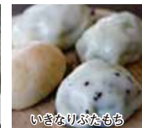
いきなりふだもち