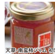
天草・南蛮柿ジャム 初恋