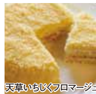
天草いちぶフロマーージュ