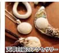
天草白磁のアクセサリー