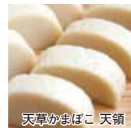
天草かまぼこ 天領