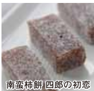
南蛮柿餅 四郎の初恋