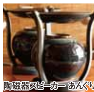
陶磁器スビーカー あんぐり