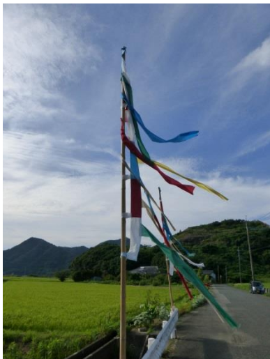
せっかく草刈をし、幟旗を立てて頂きましたが…