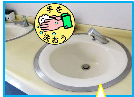
こっちの奥が自動!

また、男性トイレと女性トイレの手洗い場もそれぞれ1ヶ所だけですが自動水栓に替わりました。