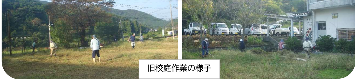
旧校庭作業の様子

9月25日(日)午前7時から、長野(20人)大迫(17人)行政区37人の協力により体育館横やグラウンド・校庭内や土手・駐車場などの雑草の除草作業が行われました。ありがとうございました。