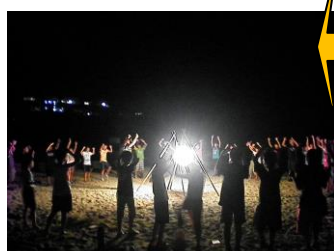
↑ 海岸でボンファイヤー