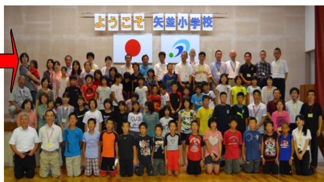
↑ 4日間、交流を深めましょう