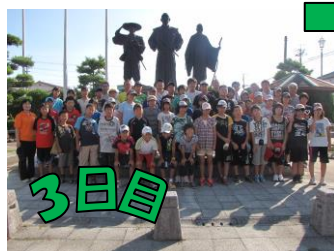
↑ 三公像前で記念撮影