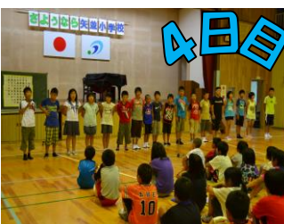
↑ 来年、また会いましょう