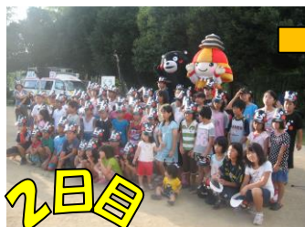
↑ くまモン体操を踊りました