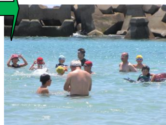
↑ 保護者の監視の下、海水浴