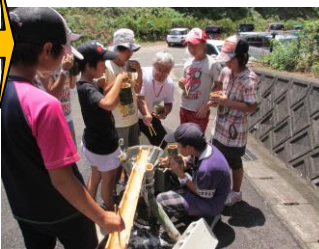
↑ 昼食はそうめん流し