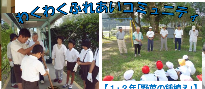
【1・2年「野菜の植ええ」】