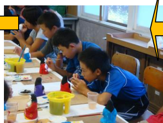
↑ 心をこめて土人形づくり