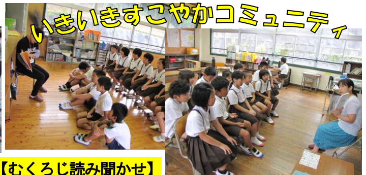
【むくろじ読み聞かせ】