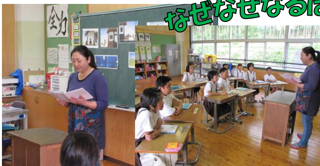
【4年国語「ごんぎつね」】