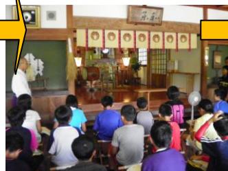
↑ 鈴木神社でお話を聞きました