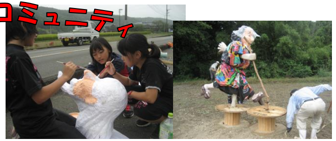
【6年「町づくりキッズ実行委員会」】