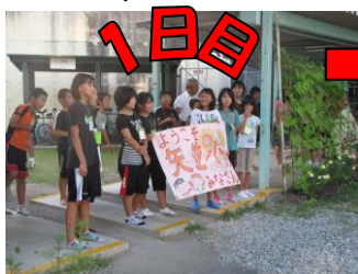
↑ 体育館でお出迎え