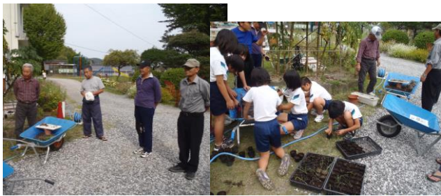
【きれいな花を育てよう】