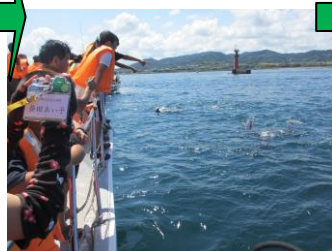
↑ 間近にイルカが見えました