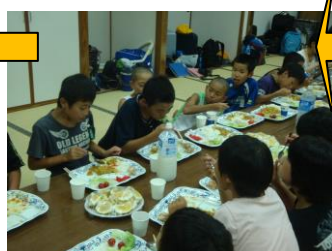
↑ 母親委員さんによる夕食