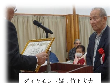
ダイヤモンド婚：竹下夫妻