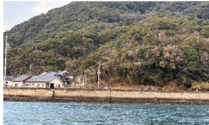
令和 8 年 (すのさき)