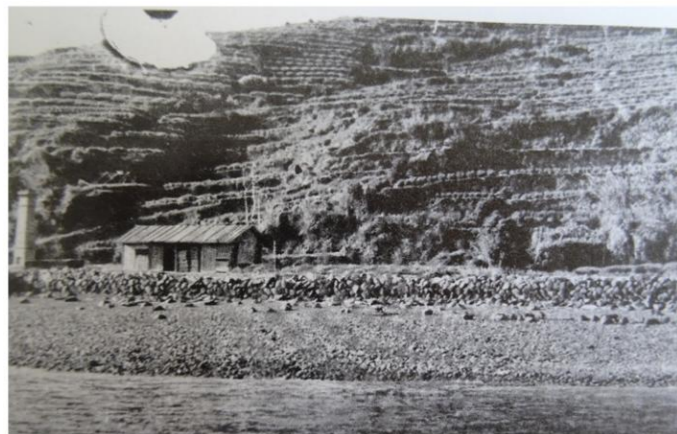
昭和 35 年頃