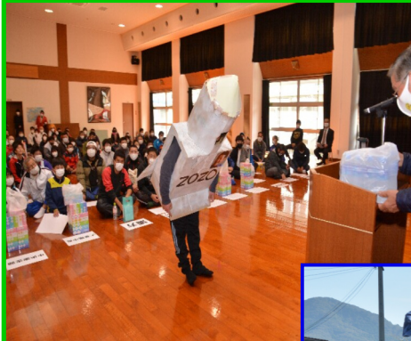
ブービー賞 ZOZOロケット (Cチーム)