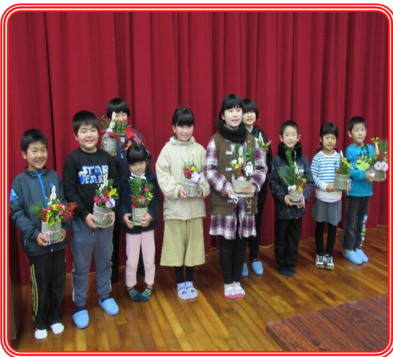
出来上がった花を持って記念撮影 (上手にできました! (^)!)

完成したミニ門松は、地元のお年寄りに良い新年を迎えてもらおうと配布し、皆さん喜ばれました。