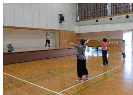
↑ スローエアロビックの様子

6月16日に「コミセンにいたてみゆう会」と名付けた健康体操を開催しました。参加者の皆さんはスローエアロビックを中心に、軽い汗を流されました。会の最後にはビンゴゲームを取り入れ、参加された皆さんは楽しい時間を過ごされました。