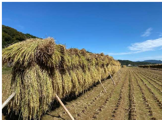
↑ 青く澄み切った秋空の下、近年は見るのが珍しくなった稲のかけ干し風景