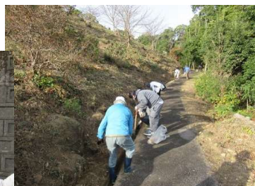
昨年度清掃活動参加の ボランティアの皆さん