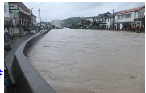
6月11日豪雨時の祇園橋付近

⇒ 近くの頑丈な建物の二階以上に、それも難しい場合は家の中の安全な場所(がけから離れた部屋や二階など)に避難しましょう。