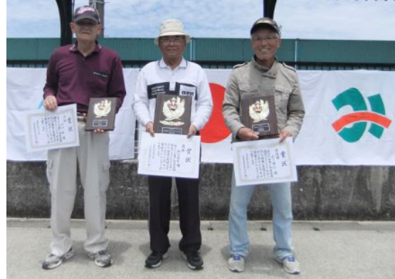
個人の部入賞のみなさん