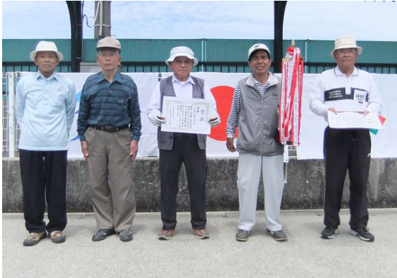
団体の部優勝 中南公南会Aのみなさん