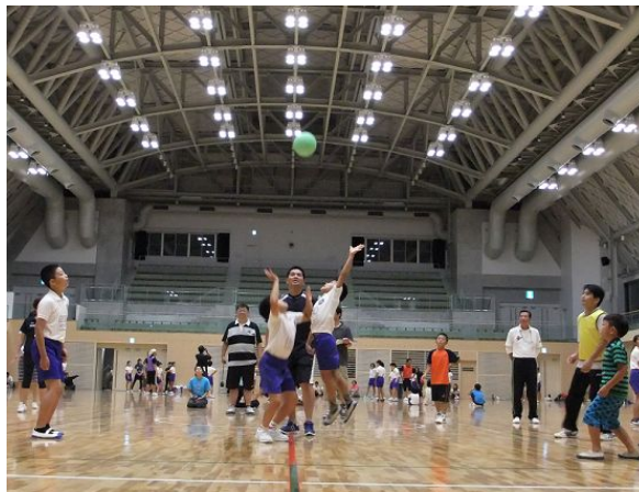
下は優勝した浄南チーム