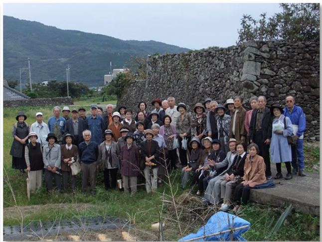
↑ 石垣群の前で参加者の皆さん