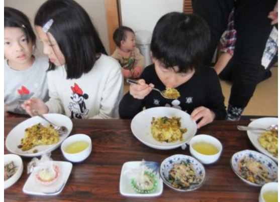
出来上がった料理を頂いています

12月17日(土)に7組18名の親子の皆さんに参加して頂き、本年度第2回の親子料理教室を開催しました。メニューは第1回と同じくカレーライス、ひじきの和風サラダ茶巾きんとんです。今回も子供たちの包丁使いには、見ている方がハラハラしながらの教室でしたが、お母さんたちには改めて子どもの成長を再認識された一日でした。